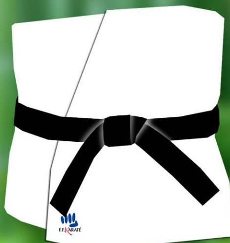
6 - Les deux bouts doivent être de même longueur et le noeud le plus le plus carré possible