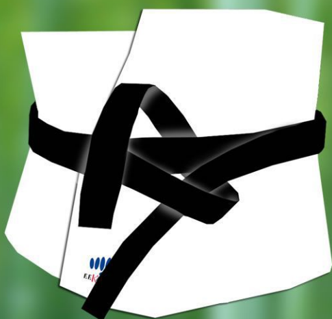
3 - Faites un premier noeud