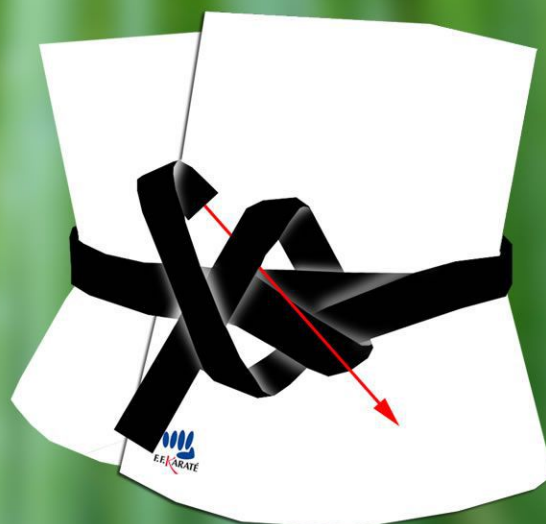
4 - Fermez le noeud