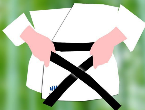
2 - Passez-la derrière vous et ramenez-la au devant, la ceinture de la main droite est au-dessus