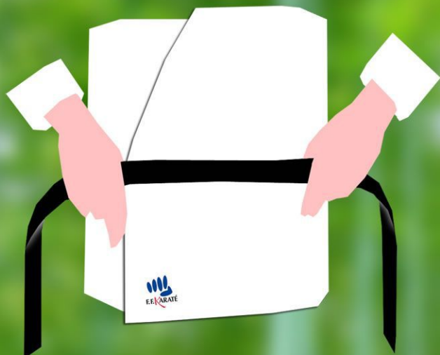
1 - Tenez la ceinture devant vous